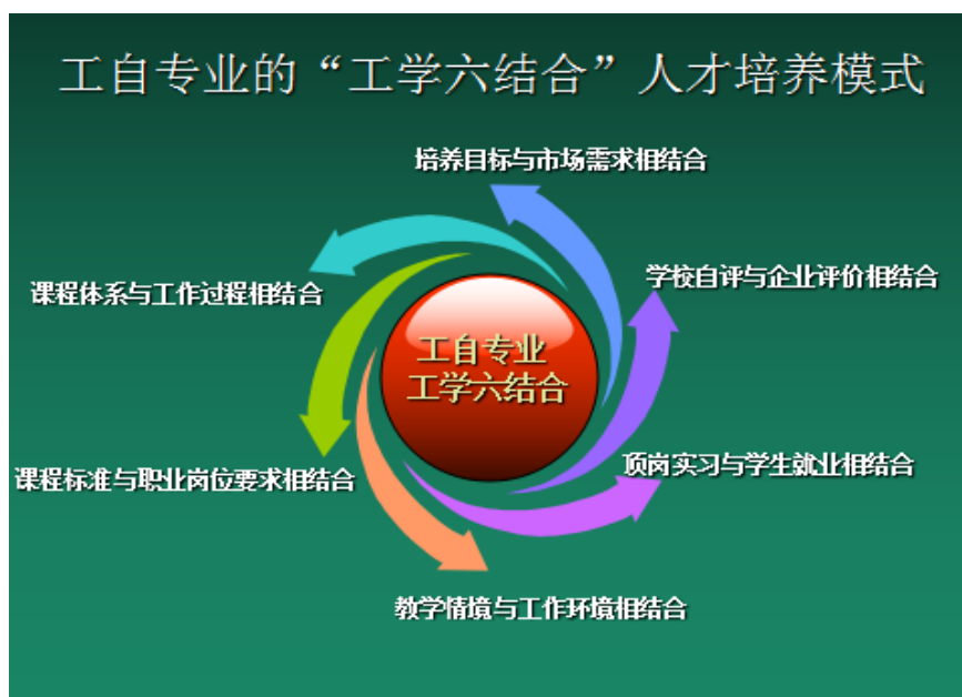
图 1 工自专业人才培养模式

西安电力高等专科学校推行“工学结合”的职业教育思想和理念，突出学生实际能力培养，创新并实施了“三体现五结合”的人才培养模式。“三体现”是人才培养目标体现就业市场需求、人才培养规格体现职业标准、人才培养方案体现学生持续发展要求；“五结合”是课程体系与工作过程相结合、专任教师与企业专家相结合、实境教学与仿真教学相结合、技能培养与素质养成相结合、过程考核与终期考核相结合。工业过程自动化技术专业（电厂方向）（以下简称“工自”专业）紧扣“工学结合”这一核心，深入开展专业需求调研，以“三体现五结合”的人才培养模式为基础，根据专业面向的岗位要求及工作特点，提炼出“坚持一条主线，强化两个结合，注重三项合作”的人才培养模式，如图 1 所示，并依此开展专业建设，制定人才培养方案。